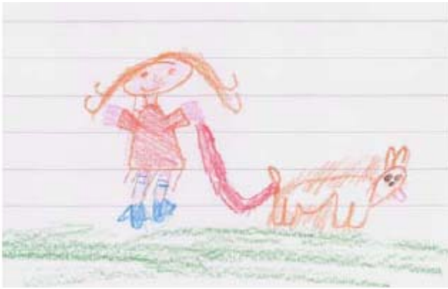
Die Nähe zu Tieren