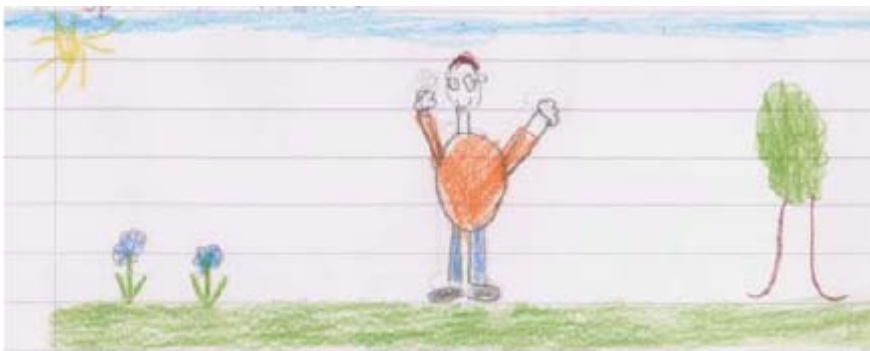
Die Nähe zu Natur

Besonders aus der Exploration des ersten Auswertungsschwerpunkts ergaben sich auch einige konkrete Vorschläge der Kinder zur Verbesserung ihrer Lebensumwelt aus ihrer Sicht. Diese betreffen meistens die Qualität des Straßenbildes und der menschlichen Beziehungen . Unter den Verbesserungsvorschlägen findet sich die besondere Kombination ästhetischer Vorschläge mit funktionellen Aspekten. Beispielsweise gibt Clara aus der Windthorststraße (3. Klasse) an, dass man Bäume pflanzen sollte. „Dadurch wirkt sie [die Straße] schön begrünt und der Verkehr ist nicht sehr störend“ .